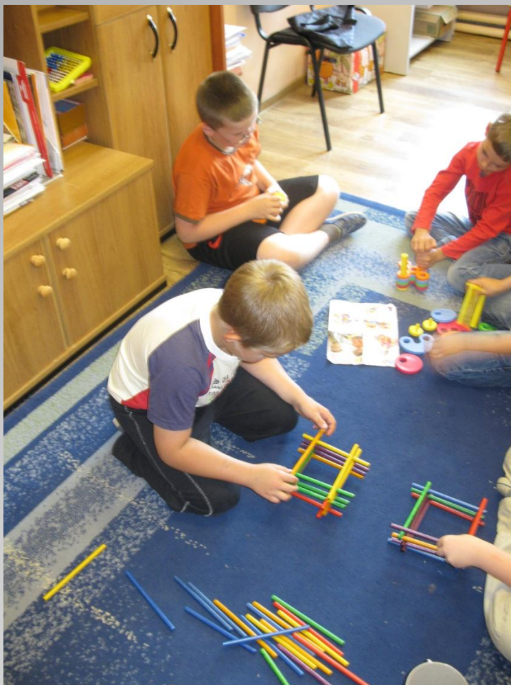
Konstrukcja „Studni Jakuba” z kolorowych klocków